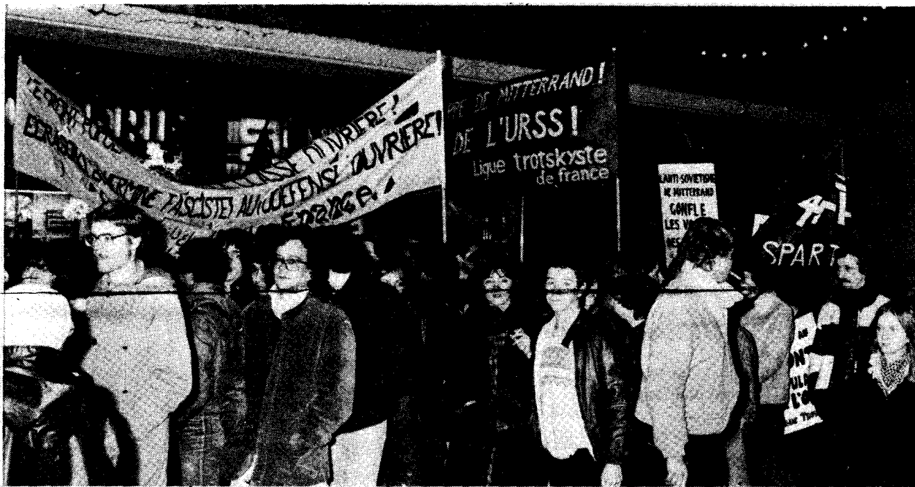
La LTF à la tête de la mobilisation contre les fascistes à Rouen le 11 décembre 1981

L'Allemagne de l'Ouest, qui était il n'y a pas si longtemps l'allié le plus loyal de Washington dans